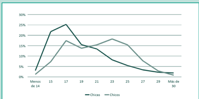
Figura 1. Edad de usuarias y usuarios en primeras visitas al CJAS por sexo

La edad pico de atención en las chicas se sitúa en los 16-17 años. Por lo tanto, las visitas son realizadas principalmente por adolescentes y, a partir de los 20 años, baja progresivamente el número de visitas. De alguna manera resulta lógico, puesto que la adolescencia es el periodo vital de definición de